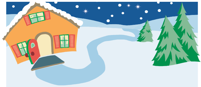
Może przed Nowym Rokiem jeszcze będzie u nas tak biało...

Inaczej jest pierwszego i drugiego dnia świąt. To